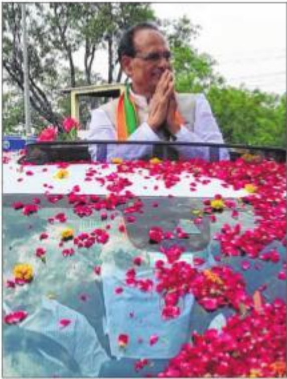
CM in road show in Bundelkhand region on Monday

Chouhan said, "When Kamal Nath was the chief minister he always used to cry for money and used to say that the treasury was empty. I have no money for development. But I say that the Bharatiya Janata Party government leaves no stone